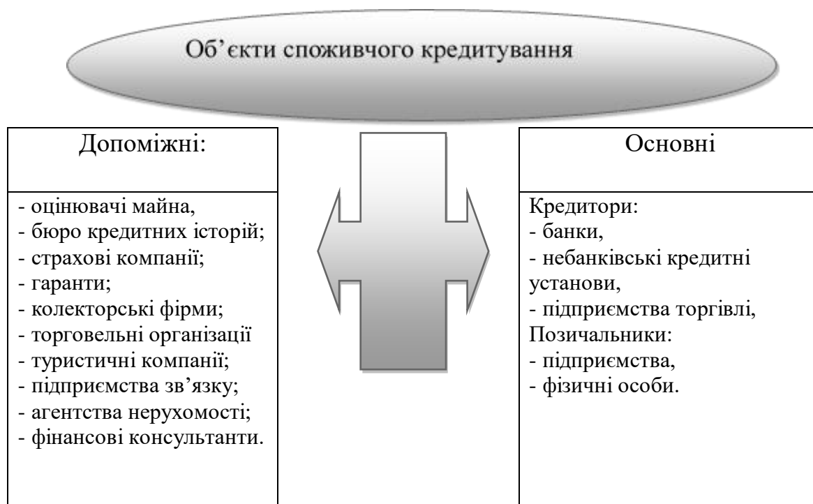
Рис. 1. Об'єкти споживчого кредитування

Не менш важливою ланкою елементного складу організаційно – економічного механізму споживчого кредитування є інструменти супроводження кредитів населення. Інструмент – це засіб, спосіб досягнення чогось [6, с. 499]. Ми до інструментів споживчого кредитування відносимо: диверсифікація кредитного портфеля, контроль за використанням кредиту, інформаційне забезпечення всіх учасників кредитних відносин, вжиття заходів щодо стягнення боргу, оцінювання кредитоспроможності позичальника, оцінювання достатності та якості застави наданих кредитів, страхування кредитних операцій.