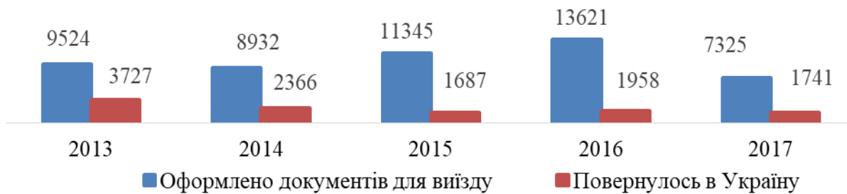
Рис. 1. Кількість оформлених громадянами України документів для виїзду за кордон на постійне місце проживання та кількість громадян, що повернулися в Україну, осіб