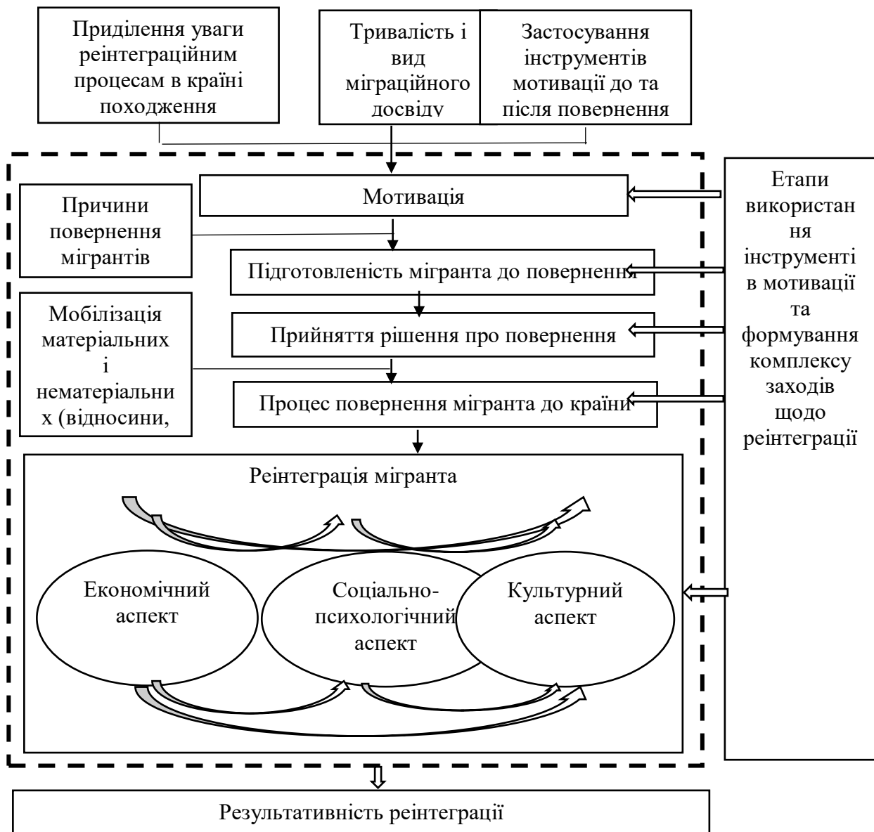
Рис. 2. Модель реінтеграції мігрантів

громад доцільно здійснювати на всіх етапах процесу: як до, так і після повернення. Модель реінтеграції мігрантів представлена на рис. 2.