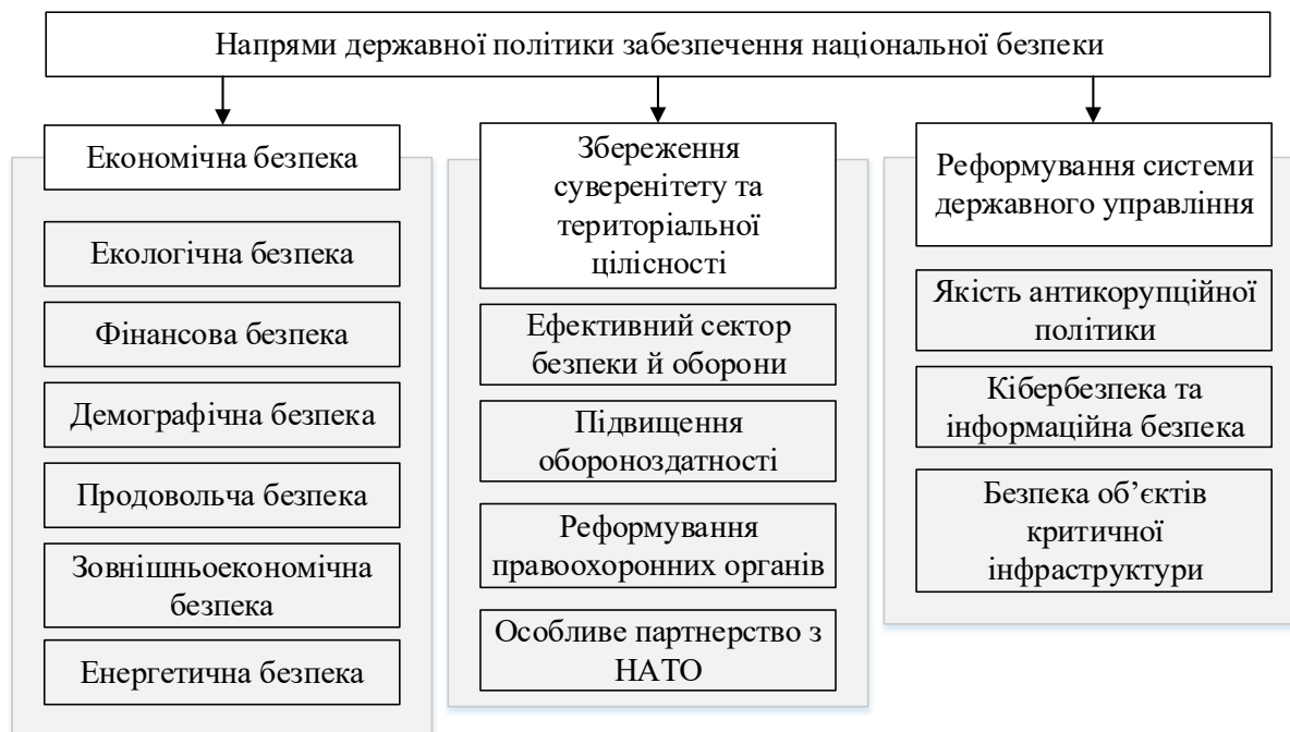
Рис. 2. Напрями державної політики при забезпеченні національної безпеки України Складено автором за [9, 11]

правоохоронних органів; реформування системи державного управління, нова якість антикорупційної політики; інтеграція в Європейський Союз; особливе партнерство з НАТО; забезпечення національної безпеки у зовнішньополітичній сфері; забезпечення економічної безпеки; забезпечення енергетичної безпеки; забезпечення інформаційної безпеки; забезпечення кібербезпеки і безпеки інформаційних ресурсів; забезпечення безпеки критичної інфраструктури; забезпечення екологічної безпеки.