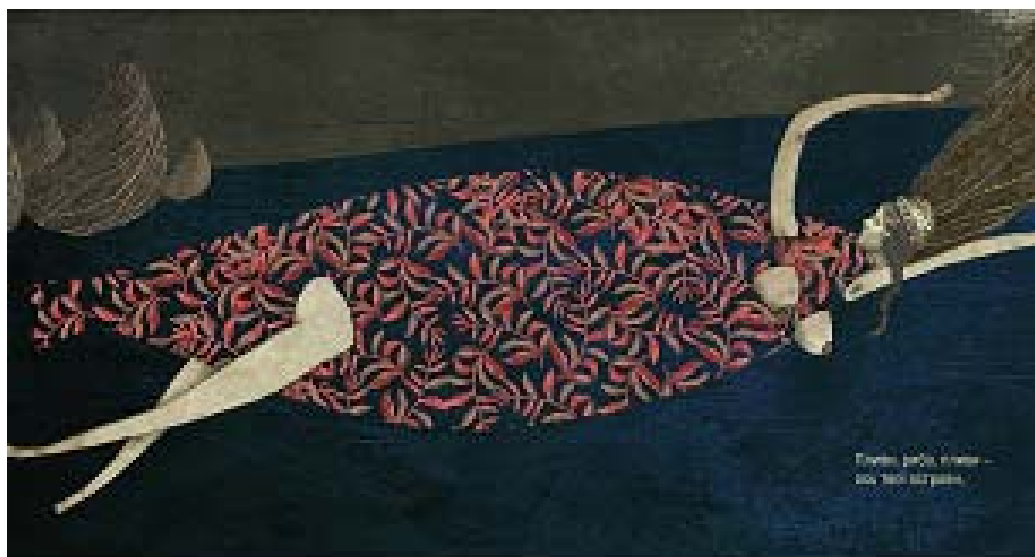
Рис. 2. «Пливи, рибо, пливи» С. Жадана