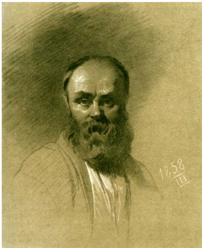
Рисунок 1. Фото автопортрета Т. Шевченка. Фотограф невідомий 1858 р.

Фотографія досить активно почала входити в ужиток у часи десятирічного Шевченкового заслання. Поет знав про її поширення з тогочасних столичних газет і журналів, котрі потрапляли і до забутого всіма Новопетровського укріплення [5]. А з Оренбурга таємно надходили сюди й самі світлини: портрети Шевченкових друзів і знімки з його власних малюнків, які митець конспіративно пересилав туди для подальшого збуту. На останньому році свого заслання поет через друзів сприяв коменданту Новопетровського укріплення в купівлі фотокамери. Однак скористатися її можливостями митцю не вдалося – камера прийшла до укріплення після його звільнення. Є думка, що першою фотографією із зображенням Т. Шевченка, яку він тримав у руках, був знімок його автопортрета 1858 р. (рис. 1)