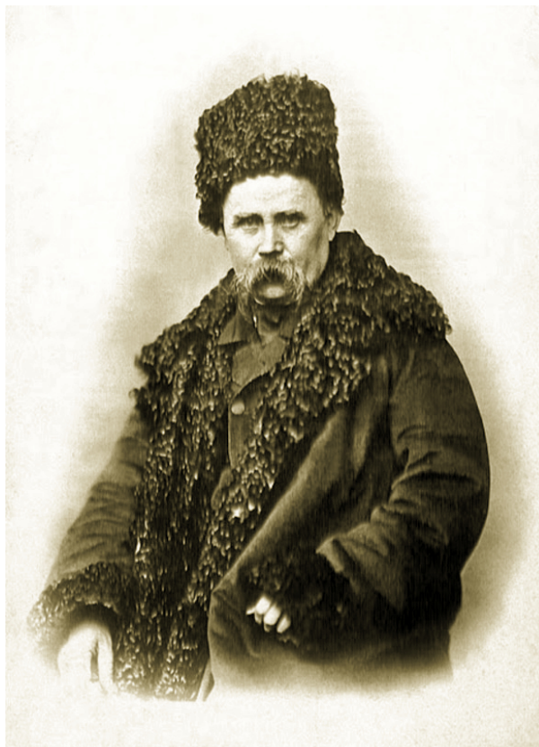
Рисунок 2. Т.Шевченко.

Фотографії, пов'язані із Т. Шевченком, стали для багатьох дослідників справою всього життя, адже в них стільки нерозгаданих таємниць. Це стосується точних дат, місць фотографування, а також самих фотографів. Наприклад, є одна фотографія, на якій зображено Т. Шевченка часто називають академіком. Досі вважали, що портрет виконано наприкінці 1860 р. чи навіть на початку 1861-го. Тривалий час дослідники висловлювали думку, що виконавцем світлини був петербурзький фотограф Александровський. Підстави для такої здогадки давав лист від 5 лютого 1861 р., адресований Тарасу Григоровичу літератором Василем Толбіним. У ньому, зокрема читаємо: «Наймиліший мій пане й господине Тарасе Григоровичу! Високоповажний! Уповаю, що Ваше дороге цінне здоров'я поправилось, прошу Вас прибути у фотографію Александровського (навпроти Казанського собору) для долучення Вашого портрета до галереї російських літераторів. Уже зняті: Щербина, Розенгейм, Курочкін, Бруні, Айвазовський, Толбін. Зверніться коротко: на запрошення Толбіна в галерею російських літераторів Тарас Григорович Шевченко, і ділу край, а ви ще одержите 12 карток» [9]. Досі шевченкознавцям було відомо тільки прізвище згаданого Толбіним фотографа.