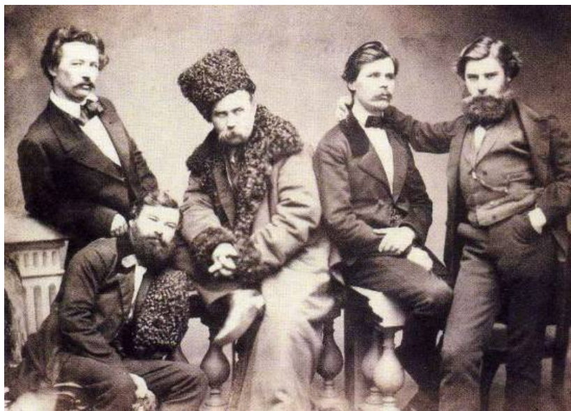
Рисунок 4. Т. Шевченко з друзями. Фотограф Г. Деньер. 1859 рік.

Збереглася світлина, де Т. Шевченко сфотографований зі своїми приятелями. Є відомості, що цю групу знімав А. Деньер (рис. 4). Найпереконливішим аргументом Деньерового авторства є бутафорна балюстрада з характерними балюстрадами, якої немає на світлинах М. Досса, О. Шпаковського, К. Бергамаско, С. Левицького, жодного іншого фотографа, зате є на понад десяти світлинах А. Деньера.