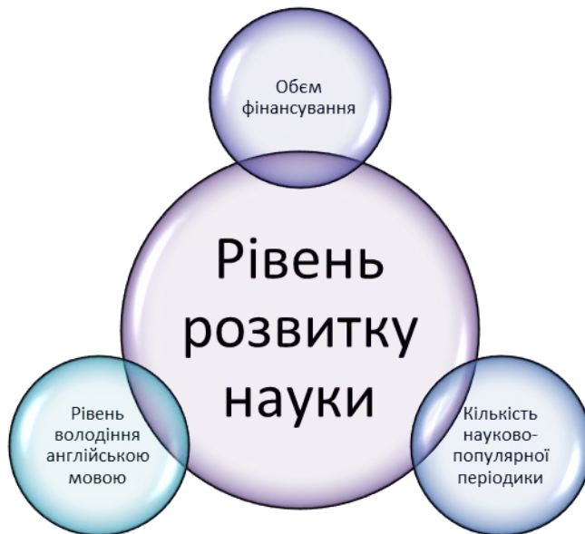
Рисунок 2. Фактори впливу на рівень розвитку науки

Отже, зважаючи на проаналізовані дані щодо фінансових внесків різних країн на розвиток науки, зокрема і на розвиток популяризації науки у науково-популярній періодиці, а також проаналізувавши кількість науково-популярних журналів, можна побачити основні фактори підвищення рівня розвитку науки, представлені на рис. 2.