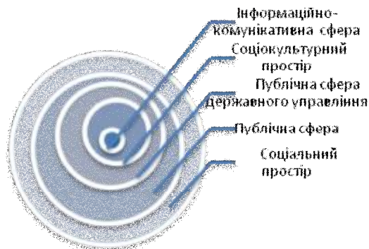
Рис. 2. Співвідношення соціального простору/публічної сфери

Важливим є з'ясування понять «простір» і «сфера». У Словнику української мови перше поняття має такі значення: одна з форм існування матерії, що характеризується протяжністю і обсягом (зв'язок простору та часу); відсутність яких-небудь перешкод у чомусь; необмежена протяжність. Поняття «сфера» трактується як «район дії, межа поширення чого-небудь (сфера впливу); громадське оточення, обстановка, середовище (політична сфера, педагогічна сфера) [9, с. 922, с. 1126].