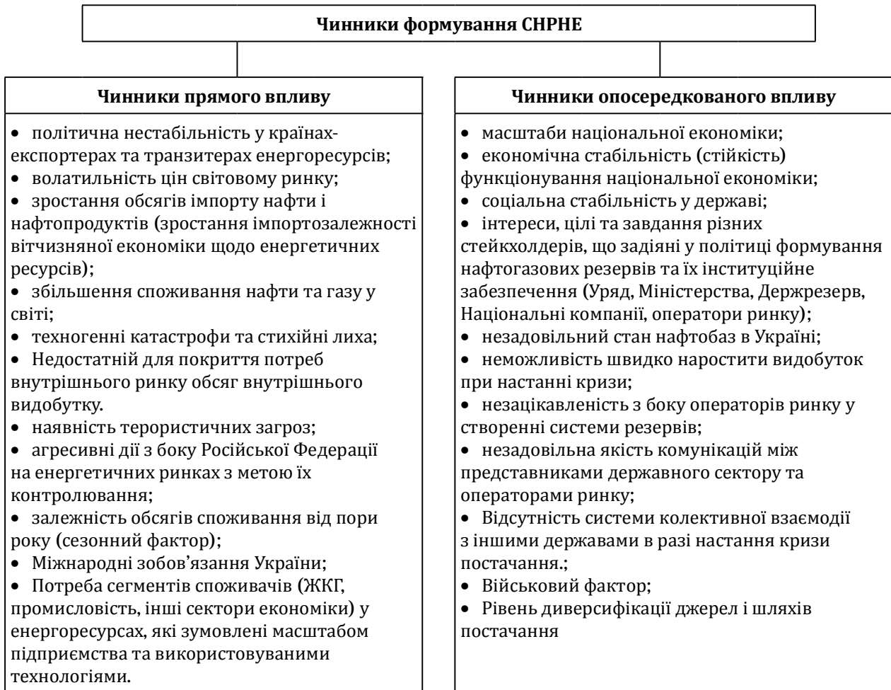
Рис. 1. Склад чинників формування СНРНЕ за характером впливу

Доцільно уточнити склад чинників створення СНРНЕ за окремими критеріями (Рис. 1, Табл. 4). Слід підкреслити, що порядок розташування представлених чинників не пов'язаний з їхньою вагомістю.