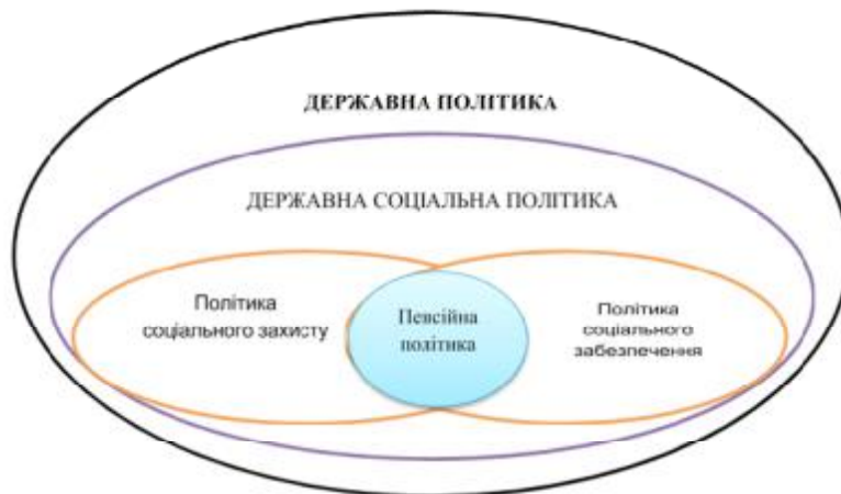
Рис.1. Логічне співвідношення між поняттями «державна політика» і «пенсійна політика» * Джерело: розроблено автором

ди були і залишаються пенсіонери. Органи державної влади виробляють сукупність засобів та методів для реалізації певних стратегічних інтересів як цієї частини суспільства, так і інших зацікавлених сторін. Тому можна вважати, що «політика пенсійного забезпечення є складовою соціальної політики держави» [7, с. 235], а її зміст залежить як від фінансово-економічних можливостей держави, так і співвідношення соціальних інтересів. Тому уже зараз можна встановити логічне співвідношення між окремими поняттями, а саме – державна політика є родовим поняттям по відношенню до державної соціальної політики, яка включає в себе політику соціального захисту і політику соціального забезпечення. У свою чергу їх складовими є пенсійна політика і політика пенсійного забезпечення (Рис. 1).