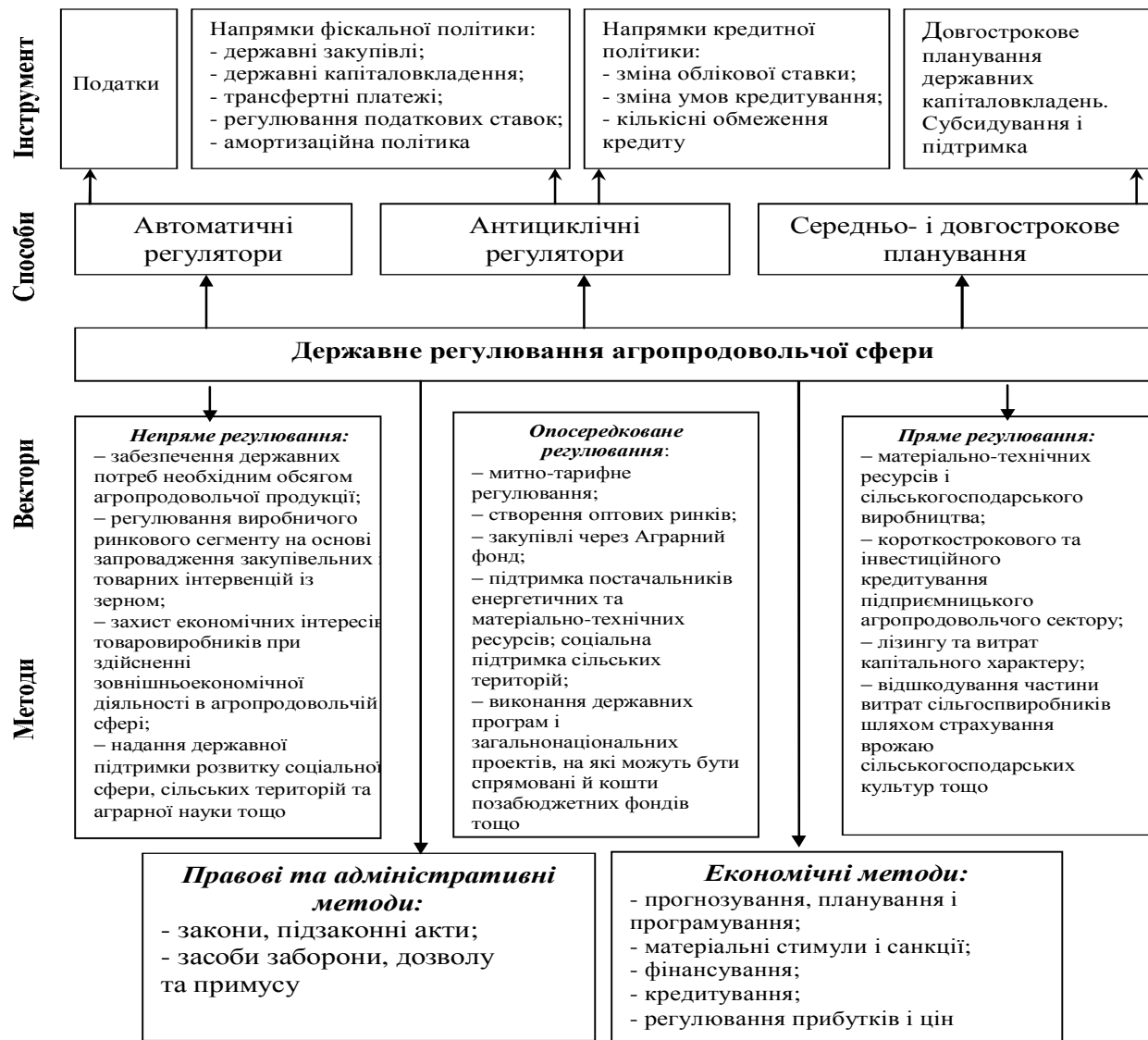
Рис. 1. Державне регулювання агропродовольчої сфери