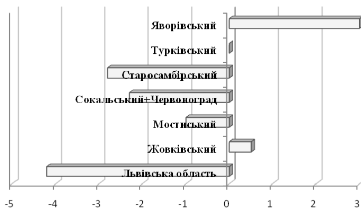
Рис. 1. Коефіцієнт природного приросту населення у Львівській області загалом та в розрізі її прикордонних районів, % (станом на 1 січня 2010 р.)

Загальна площа прикордонного регіону Львівської області, яким охоплено шість АР (Сокальський, Жовківський, Яворівський, Мостиський, Старосамбірський та Турківський) складає 35 % її території. Тут проживає \frac{1}{5} населення області (596 тис. осіб). Незважаючи на спільне для окреслених АР прикордонне положення з Республікою Польща, їхні демографічні реалії доволі диференційовані. Порівняно із загальнообласними показниками депопуляція населення відбувається слабшими темпами, а в Яворівському та Жовківському районах узагалі зафіксовано його природний приріст (рис. 1).