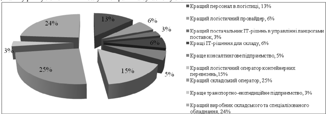
Рис. 1. Структура активності учасників конкурсу логістичних операторів України [13].

З цього також можна зробити висновок про те, що ринок логістичних послуг відчуває істотні кількісні зміни, передусім щодо впливу кризи, однак не відбуваються прогресивні зміни у якісних параметрах логістичного аутсорсингу. Світовий досвід показує тенденцію зниження попиту на послуги логістичного аутсорсингу, причому значно менше зниження відчуває внутрішня логістика. І це певним чином впливає на динаміку ринку логістичних послуг в Україні на сучасному етапі.