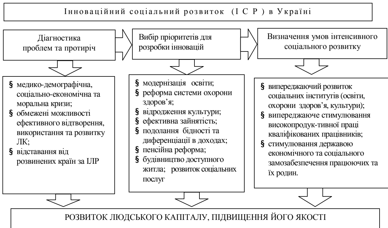
Рис. 2. Підвищення якості людського капіталу в Україні на основі визначення та реалізації пріоритетів інноваційного соціального розвитку

соціальної сфері на засадах впровадження інноваційного соціального розвитку. В Україні вирішення цієї проблеми має виняткове значення, оскільки формування ЛК відбувається на тлі медико-демографічної, соціально-економічної та моральної криз, які негативно позначаються на його характеристиках (стані здоров'я, якості освіти, мотивації, активності тощо), обмежують можливості його ефективного розвитку та використання. Наш підхід щодо підвищення якості ЛК в Україні на засадах інноваційного соціального розвитку відображає рис. 2.