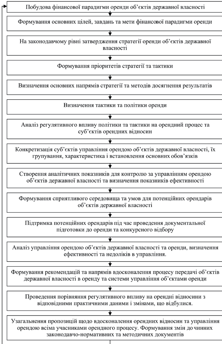
Рис.1. Побудова дерева цілей оренди об'єктів державної власності в Україні