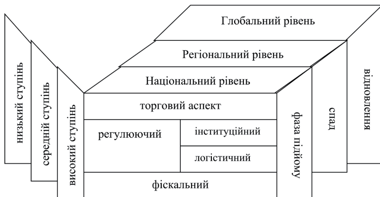
Рис. 1. Модель структури активності країни у митному просторі

Щодо циклічності активності країн, то вона не є постійною як у часовому вимірі, просторовому, так і за ступенем прояву. Пропонуємо лише три її фази (підйому, спаду, відновлення) з таких причин. По-перше, активність у межах простору не має так званого “пікового” значення, досі були відсутні дослідження щодо числового виміру активності. По-друге, взаємодія країн у митному просторі формується під впливом сукупності чинників, що торкаються різних сфер соціально-економічних відносин. По-третє, активність у митному просторі є мобільним явищем та здатна до швидкої трансформації, тому тривалість циклів різна для різних країн.