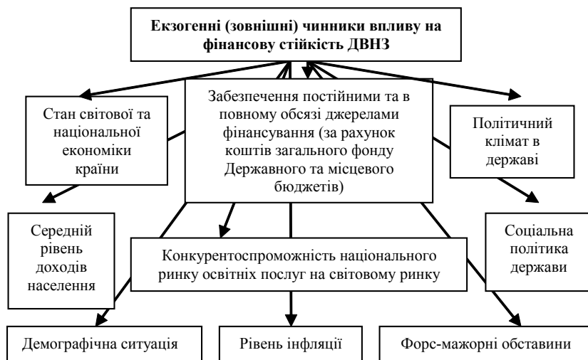
Рис. 1. Екзогенні (зовнішні) чинники впливу на фінансову стійкість ДВНЗ*

До екзогенних чинників можемо віднести (рис. 1):