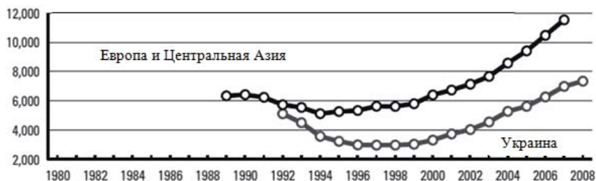
Рис. 2. ВВП (ППС в дол. США) на душу населення, 1988-2008 гг. [8]

Принимая во внимание наличие во многих странах мира до экономического кризиса факторов уязвимости, развивающиеся страны Европы и Центральной Азии подверглись в большей степени воздействию кризиса, при этом в 2009 г. их ВВП сократился на 6,2%. Несмотря на то, что прогноз роста ВВП составляет 2,7% в 2010 г. и 3,6% в 2011 г., темпы роста в большинстве стран будут по-прежнему сохраняться на уровне ниже потенциала [8]. Динамика ВВП по паритету покупательной способности (ППС) в долларах США для Европы и Центральной Азии, а также Украины представлена на рис. 2.