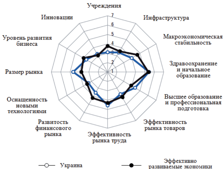
Рис. 4. Глобальный индекс конкурентоспособности (ГИК) 2009-2010 гг. в разрезе составляющих [9]

Для оценки конкурентоспособности, основным инструментом стал Глобальный Индекс Конкурентоспособности (ГИК), который является исчерпывающим индексом для измерения национальной конкурентоспособности и учитывает микро– и макроэкономические основы национальной конкурентоспособности. Сравнение индекса Украины с индексами с более успешных развивающихся стран, представлено на рис 4.