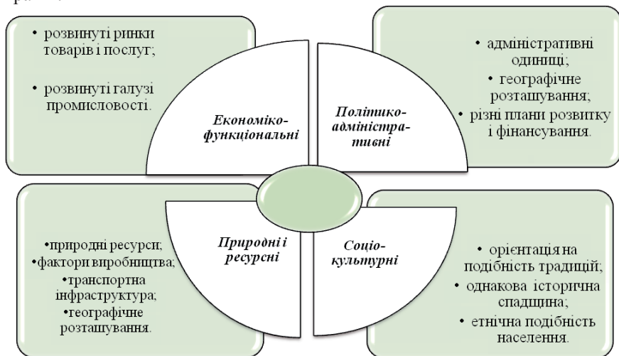
Рис. 1. Класифікація регіонів за Яухайненом

нів за Яухайненом [1, с. 2] (рис. 1), то бачимо, що сутність цього поняття залежить від основних характеристик, що водночас є критеріями регіонування країни.