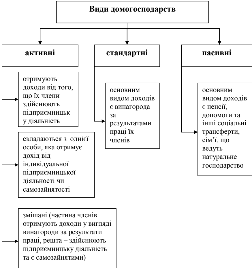
Рис. 2. Класифікація домогосподарств залежно від участі в економічному обміні*