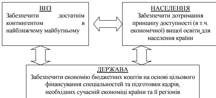
Рис. 1. Узгодженість інтересів суб'єктів ринку освітніх послуг на основі чинника рівня фінансування освіти

Варто зазначити, що модель фінансування вищої освіти на основі впровадження додаткових податків не знайде своєї підтримки в українському суспільстві на цьому етапі розвитку економіки країни, враховуючи сучасний незадовільний рівень платоспроможності населення та фінансовий стан більшості підприємств. Тому більш детально зупинимось на розгляді перших двох запропонованих схем фінансування.