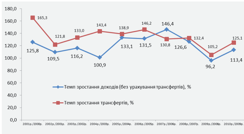
Рис. 2. Динаміка зростання доходів і трансфертів місцевих бюджетів за 2000-2010 рр. [3]

Частка трансфертів у доходах місцевих бюджетів зростає з 29,0% (2000 р.) до 49,1% (2010 р.). Темпи зростання доходів (без урахування трансфертів) за період дослідження значно нижчі за темпи зростання трансфертів (рис. 2).