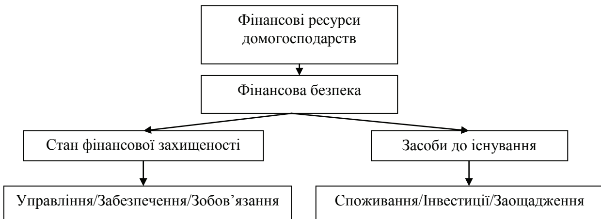
Рис. 3. Засади формування фінансової безпеки домогосподарств

Засадами для формування фінансової безпеки домогосподарств повинна бути система поглядів на те, яким має бути стан їх фінансової захищеності та якими засобами його можна забезпечити (рис. 3).