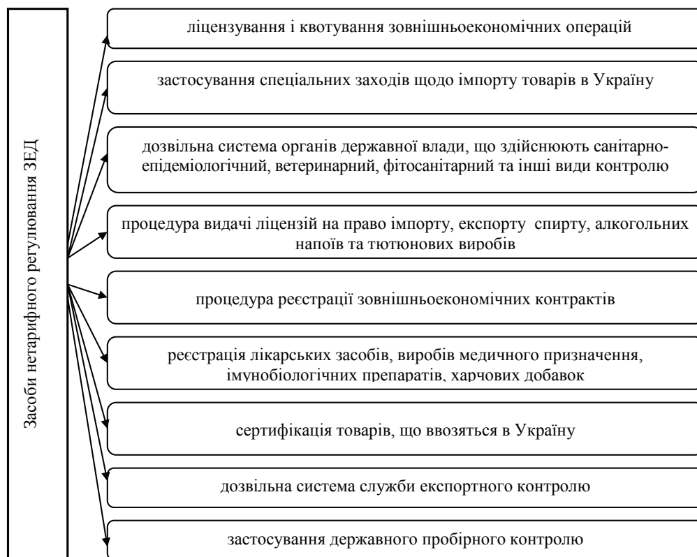
Рис. 1. Засоби нетарифного регулювання ЗЕД

1) засоби тарифного регулювання. До них належать регулювання цін і тарифів, встановлення різних видів мит, зборів та інших загальнообов'язкових платежів, надання інвестиційних, податкових та інших пільг, дотацій, компенсацій, цільових інновацій та субсидій, встановлення штрафних санкцій за цільових інновацій та субсидій, встановлення штрафних санкцій за порушення правил здійснення зовнішньоекономічної діяльності, тощо;