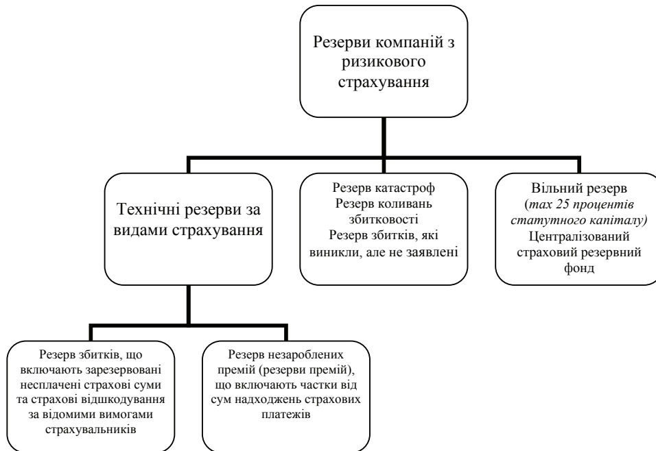
Рис. 3. Система резервів компаній з ризикового страхування

Систему резервів компаній з ризикового страхування ілюструє рисунок 3.