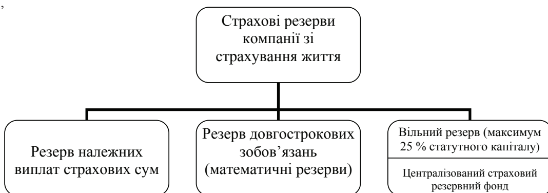
Рис. 4. Система резервів компаній зі страхування життя

Резерви компаній зі страхування життя мають у своєму складі такі елементи (рис. 4).