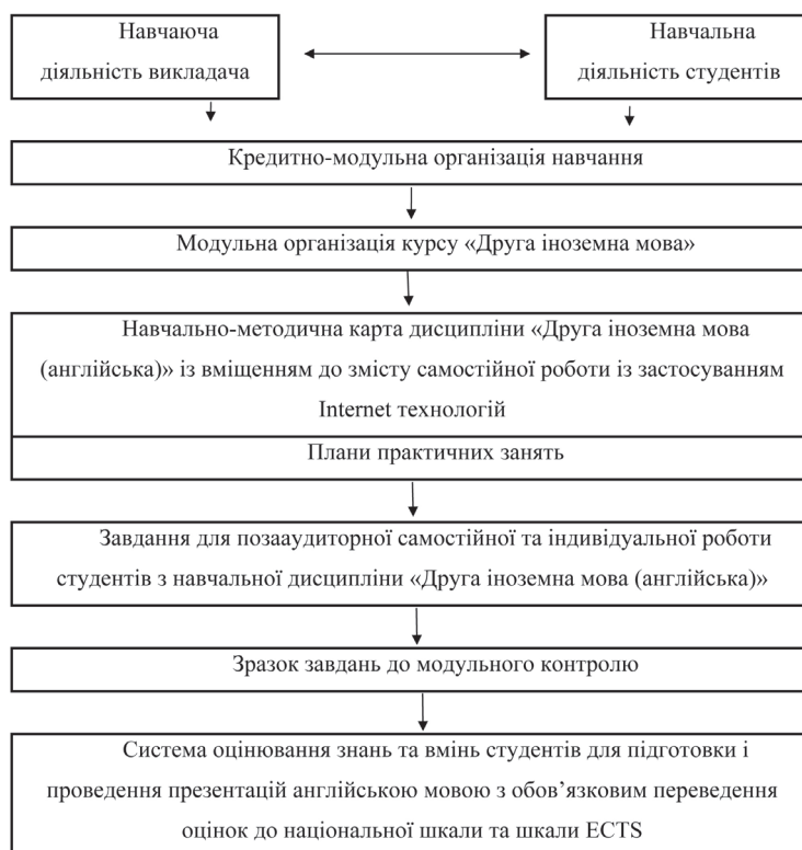
Схема 2. Модель кредитно-модульної організації формування іншомовної комунікативної компетенції студентів мовних спеціальностей у процесі вивчення другої іноземної мови (англійської)

Всі описані вище елементи у сукупності складають цілісну модель кредитно-модульної організації формування іншомовної комунікативної компетенції студентів мовних спеціальностей у процесі вивчення другої іноземної мови (англійської) (див. Схему 2).