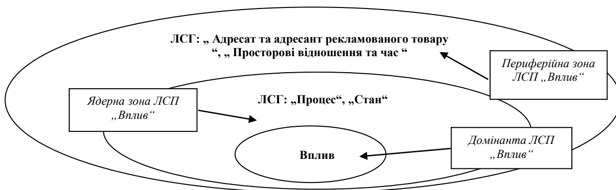
Рис. 2 Модель лексико-семантичного поля „Вплив“

Нами було встановлено, що використання перекладацьких стратегій на лексико-семантичному рівні функціонування системи мови спрямоване на збереження прагматичної спрямованості тексту оригіналу (далі ТО) під час трансляції.