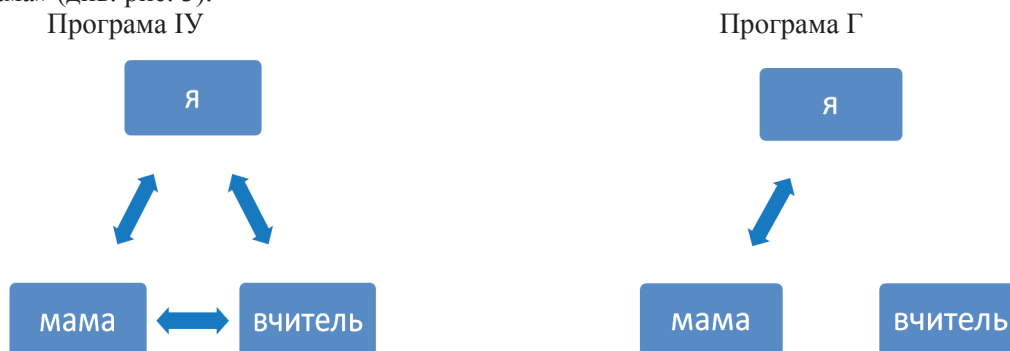
Рис. 3. Система взаємодії структури самооцінки першокласників

Зазначимо, що при аналізі системи взаємодії структури самооцінки першокласників, ми бачимо, що у дітей, які навчаються за програмою «Інтелект України», ця система є цілісною, водночас у дітей які навчаються за гімназійною програмою, самооцінка ґрунтується лише на взаємодії полюсів «Я» та «Мама» (див. рис. 3).