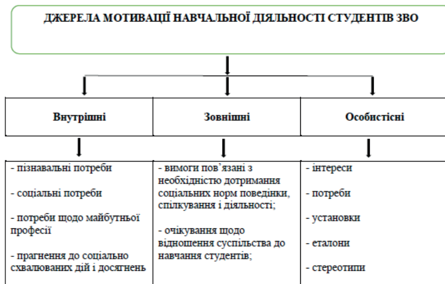
Рис. 1. Джерела мотивації навчальної діяльності студентів ЗВО

У науці виділено три основних джерела активності студентської навчальної діяльності: внутрішні, зовнішні та особистісні. Зрозуміло, що основні внутрішні джерела – соціальні і пізнавальні потреби студентської молоді у соціокультурному середовищі, а також їхні професійні прагнення, які вимагають соціального схвалення і затвердження. Зовнішні умови середовища, у якому функціонують студенти, а саме: соціальні норми цього суспільства, що стосуються поведінки, дотримання соціальних норм суспільства, спілкування тощо визначають зовнішні джерела мотивації. Навчальну діяльність студентів сприймаємо як необхідну передумову і норму суспільної поведінки, від дотримання якої залежить успішність навчальної та майбутньої професійної діяльності [13].