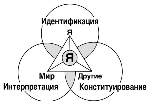
Рис. 1. Механизмы конструирования картины мира личности

обладает собственной функциональной и сущностной спецификой. Кроме того, рассмотрение картины мира как открытой саморазвивающейся системы позволяет раскрыть функции выделенных механизмов на двух уровнях: внутрисистемном – конструирования картины мира личности, и внешнесистемном – организации жизни, что и будет показано нами ниже.