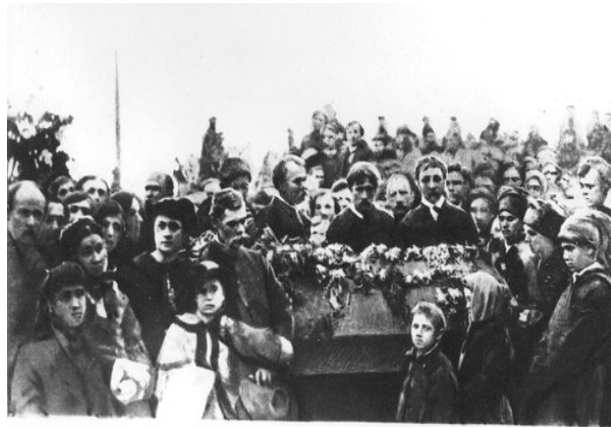
Панахида під час перепоховання праху Шевченка. Київ, травень 1861 року

поклала на труну поета терновий вінець, що символізувало нелегке й багато в чому скорботне життя Шевченка (див. фото) .