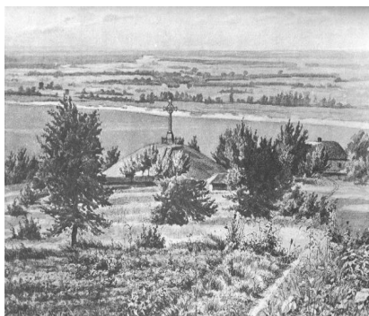
Чагунний хрест на могилі Шевченка. Фото з журналу "Нива", 1901 рік [1]