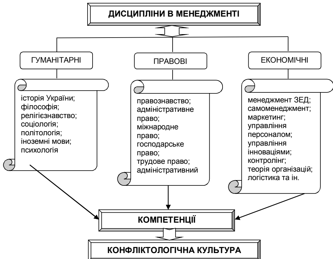
Рис. 1. Інтегративний підхід у формуванні конфліктологічної культури при підготовці менеджерів у вищих навчальних закладах авіаційної галузі

Не можна з цим не погодитися. Оскільки освоєння фахівцем-менеджером потрібних компетенцій, безумовно, може в достатньому ступені реалізовуватися за рахунок міждисциплінарного підходу, а саме набуття конфліктологічної культури протягом вивчення перерахованих нижче дисциплін (рис. 1).