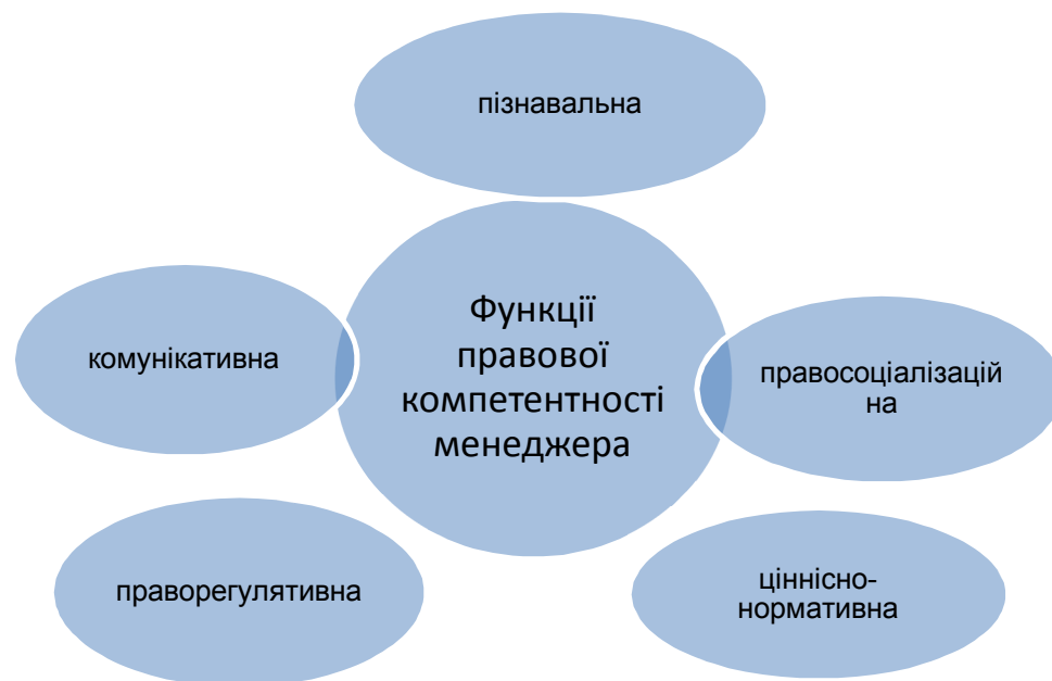
Рис. 2. Функції правової компетентності менеджера організації

У ході наукового пошуку нами з'ясовано функції правової компетентності менеджера (рис. 2):