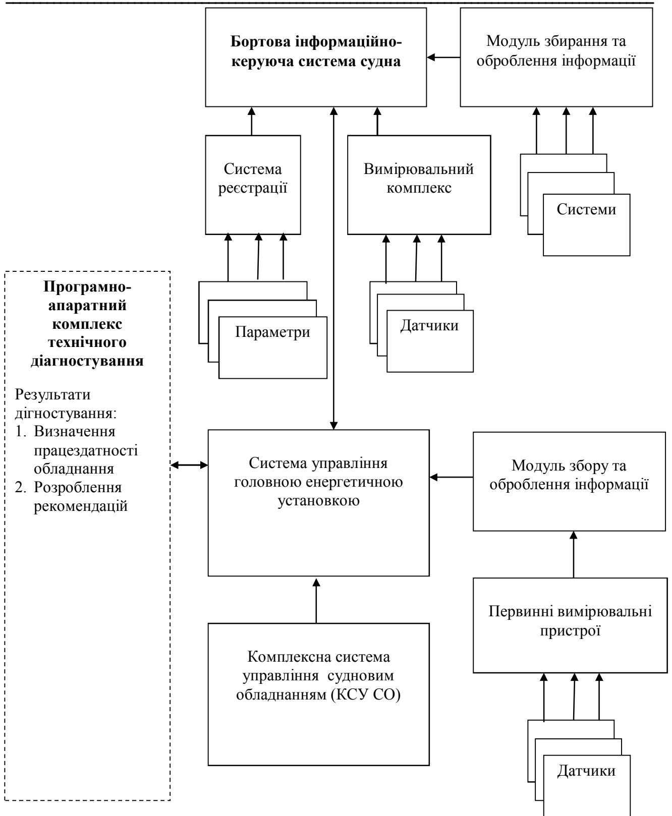
Рис. 1. Комплексна система діагностики суднового обладнання

Відтак, загальний алгоритм реалізації даної процедури у ПАК ТД має вигляд, наведений на Рис. 2.