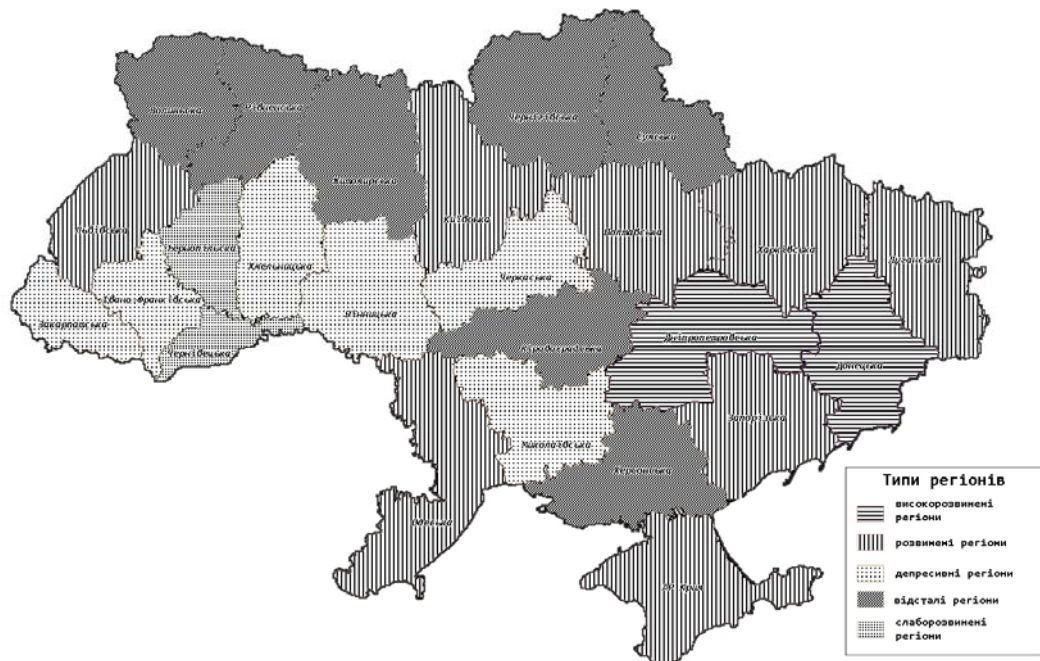
Рис. 2. Типи регіонів

Виконуючи поставлене завдання, – типізації регіонів за поєднаною системою рівня розвитку і загальним потенціалом регіону, враховуючи попередні авторські дослідження, характеристику різних варіантів груп регіонів, ми передбачаємо дві ситуації. Перша – певна група виявиться надто відмінною від інших, друга ситуація – групи мають багато спільних характеристик і ми маємо право їх об'єднати. Тому, враховуючи вищезазначене, на основі виділених груп регіонів, наукового аналізу існуючих підходів та авторського бачення проблем регіонального розвитку, нами було виділено в межах України п'ять типів регіонів (рис. 2).