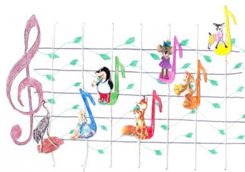
Рис.2. «Музично-ігрова діяльність»