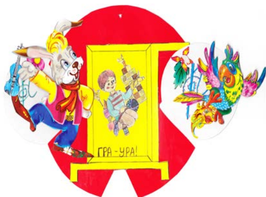
Рис.3. «Гра – ура!»