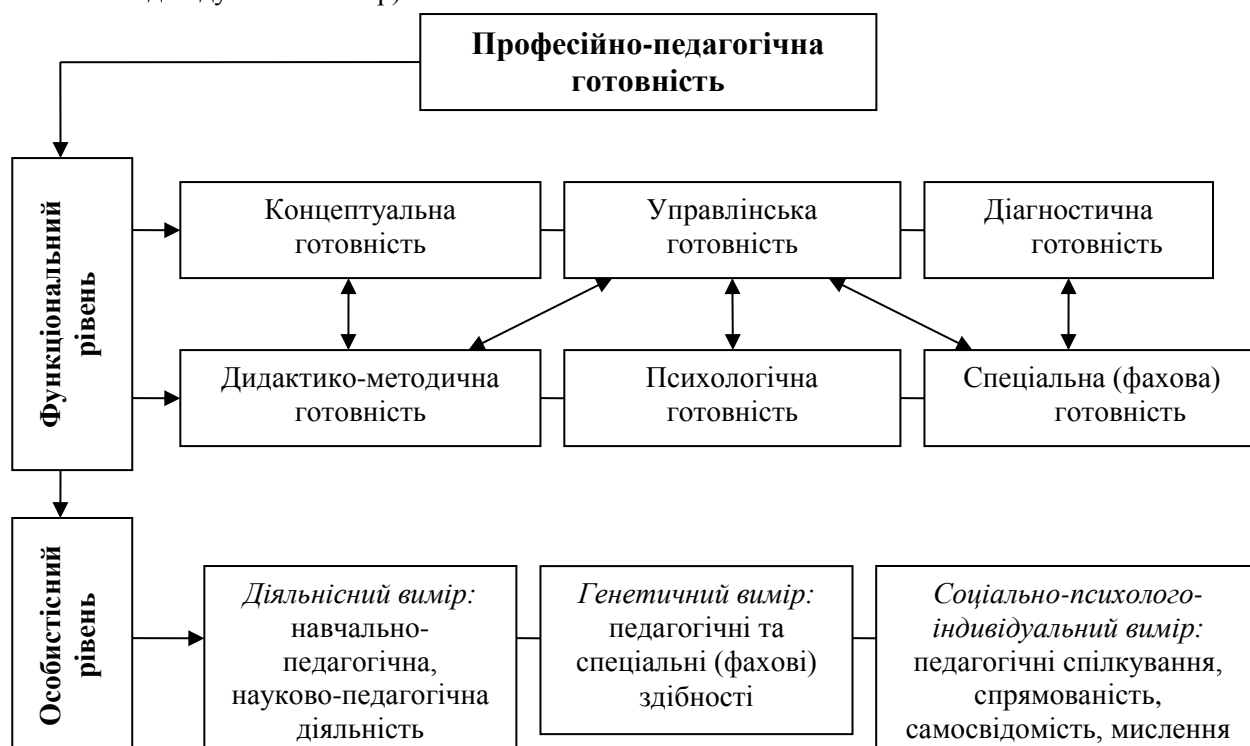
Рис. 1. Структура професійної готовності майбутніх учителів

З огляду на обґрунтовану В.В.Рибалком [7, с. 144-155] концепцію тривимірної психологічної структури особистості, вважаємо, що структуру особистісного рівня професійно-педагогічної готовності студентів формують такі компоненти (рис. 1): навчально-педагогічна і науково-педагогічна діяльність (діяльнісний вимір); педагогічні й спеціальні (фахові) здібності (генетичний вимір); педагогічне спілкування, педагогічні спрямованість і самосвідомість, педагогічне мислення (соціально-психолого-індивідуальний вимір).