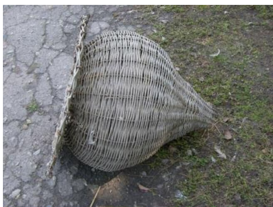
Фото верші з алюмінієвого дроту.