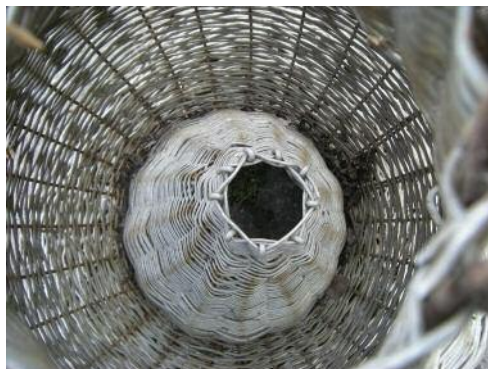
Вигляд вхідної частини з середини верші.