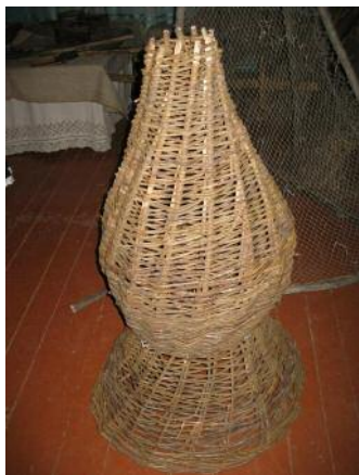
Верша з брилем.