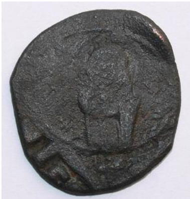
Рис 15. Фоліс №7 Аверс