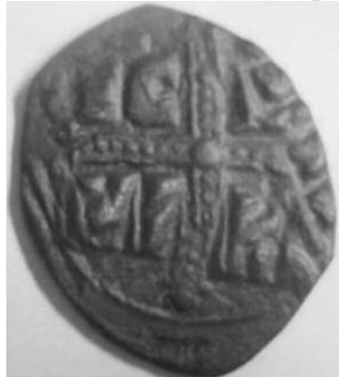
Рис 10. Фоліс №4 Реверс