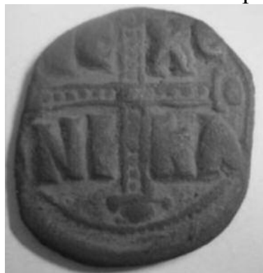
Рис 8. Фоліс №3 Реверс