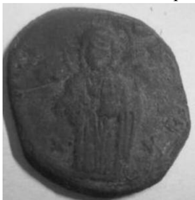
Рис 7. Фоліс №3 Аверс