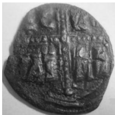
Рис 4. Фоліс №1 Реверс