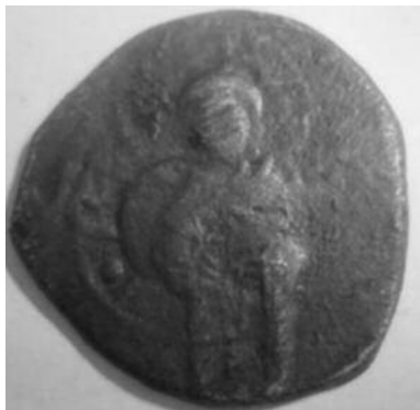
Рис 5. Фоліс №2 Аверс