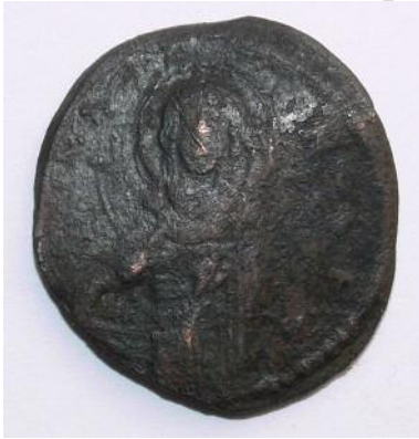
Рис 17. Фоліс №8 Аверс