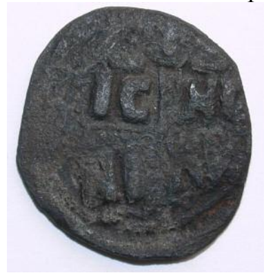
Рис 16. Фоліс №7 Реверс