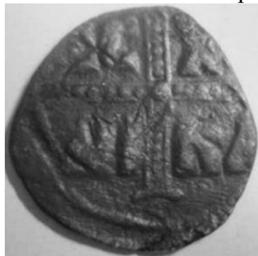
Рис 6. Фоліс №2 Реверс