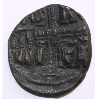
Рис 18. Фоліс №8 Реверс