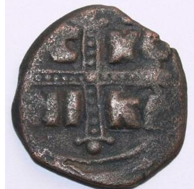
Рис 14. Фоліс №6 Реверс