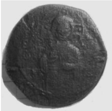
Рис 11. Фоліс №5 Аверс