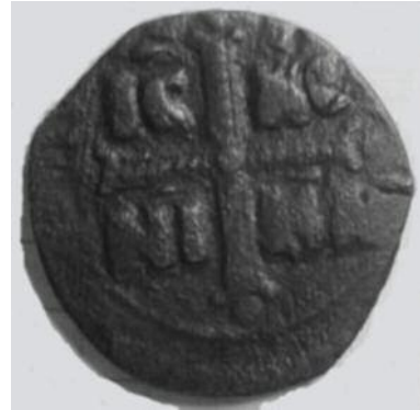
Рис 12. Фоліс №5 Реверс