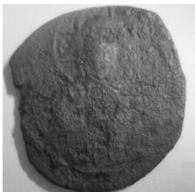
Рис 3. Фоліс №1 Аверс

Рис. 3–18. Скарб візантійських анонімних фолісів класу “С”, знайдений на березі річки Сухий Згар Золотоніського району Черкаської області.