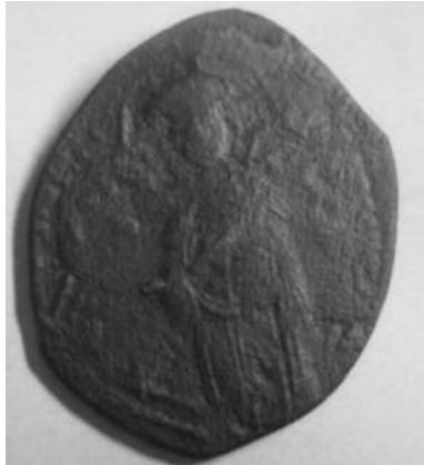
Рис 9. Фоліс №4 Аверс