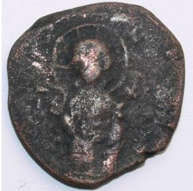
Рис 13. Фоліс №6 Аверс