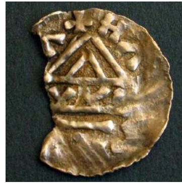
Фото 10. Наслідування денаріям баварських герцогів другої половини X століття. Вага 1, 05 гр. Місце знахідки Чернігівська область