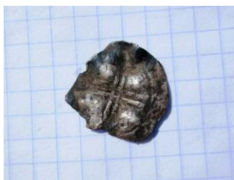
Фото 9. «Комбінований» тип наслідування денарія Оттона III та англо-саксонського денарія. Вага - 1, 21 гр. Місце знахідки невідоме