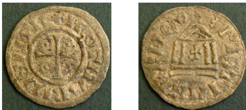
Фото 3. Наслідування денарія Лотаря I (Каролінги). Вага - 1, 21 гр. Місце знахідки Житомирська область