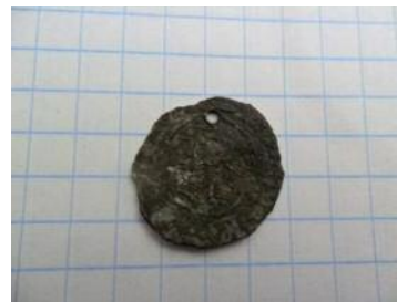
Фото 12. Фальшований денарій з хрестами. Вага - 0, 40. Місце знахідки Київська область