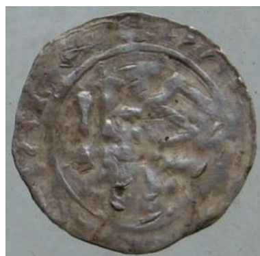
Фото 7. Наслідування денарія Оттона III та Адельгейди. Вага - 1, 05 гр. Місце знахідки невідоме