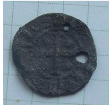
Фото 11. Фальшований денарій з хрестами. Вага і місце знахідки невідомі