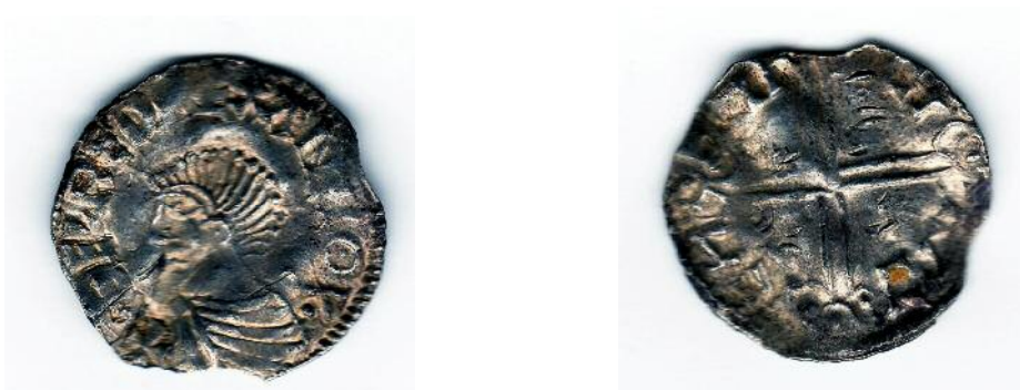
Фото 5. «Балтійське» або скандинавське наслідування пенні Етельреда II. Вага - 1, 25 гр. Місце знахідки Чернігівська область