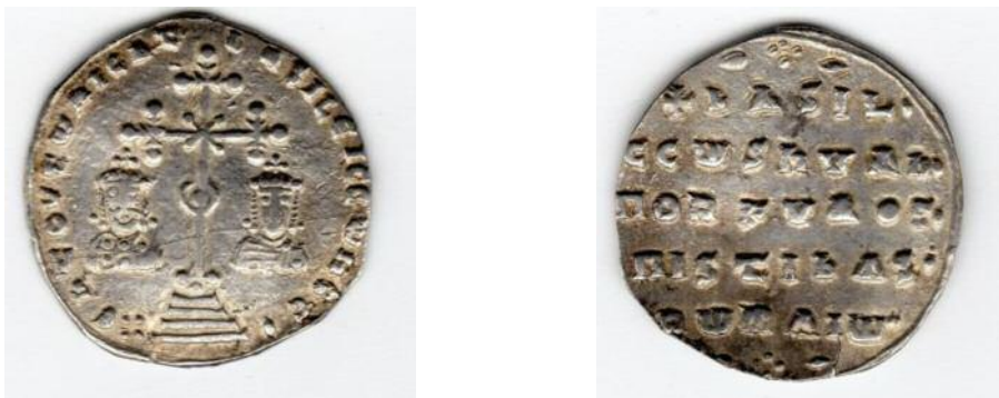
Фото 4. Наслідування візантійського міліарісія. Вага - 2, 48 гр. Місце знахідки Житомирська область