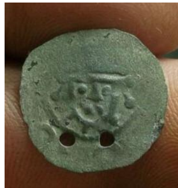
Фото 14. Фальшований денарій, що наслідує саксонський денарій, карбований у Йевері. Вага - 0,53 гр. Місце знахідки Полтавська область