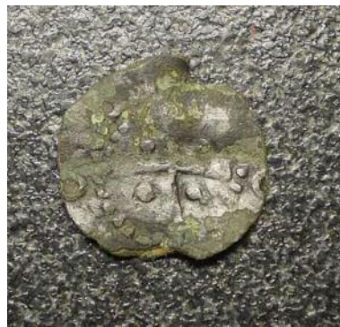
Фото 16. Фальшоване наслідування денарія міста Кельн. Вага - 0,49. Місце знахідки Чернігівська область