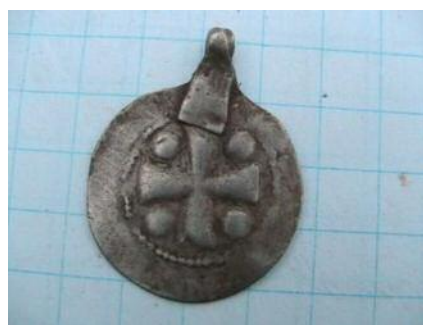
Фото 3. Наслідування денарія Оттона III або Конрада II, карбованого у місті Майнц (?). Вага - 1, 00 гр. Місце знахідки Київська область