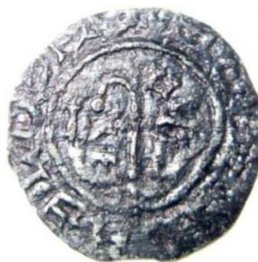
Фото 17. Фальшоване наслідування денарія єпископа Бернольда. Вага - 0,65. Місце знахідки Київська область