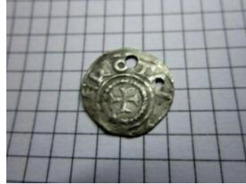
Фото 13. Денарій міста Дортмунд, що міг бути прототипом фальшованих денаріїв, зображених на фото 11 та 12