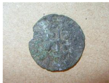
Фото 15. Фальшоване наслідування «ранньої вендки». Вага - 1,26. Місце знахідки Житомирська область