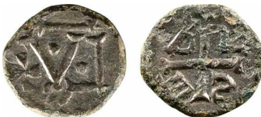
Фото 2. Меровінгський денарій, що мав слугувати прототипом для наслідування, зображеному на Фото 1. Місто Марсель, VII-VIII століття