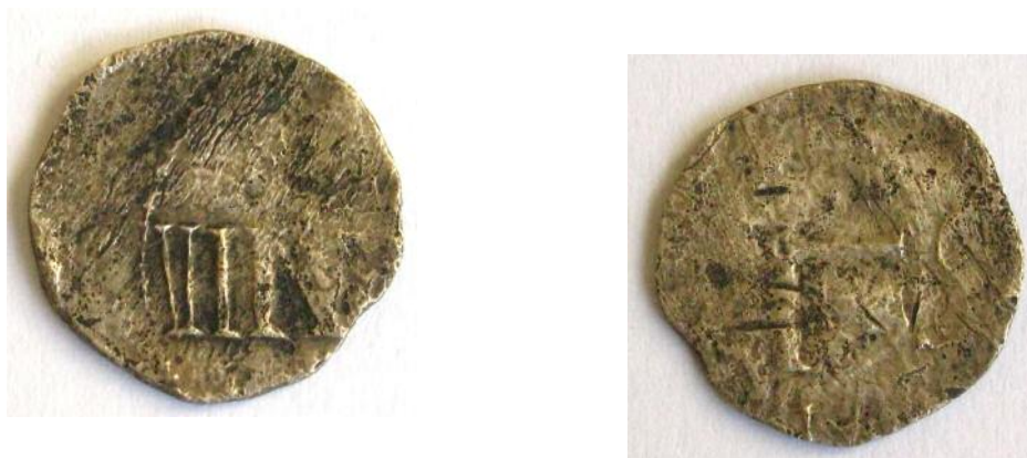
Фото 1. Наслідування денарія Меровінгів. Вага - 1, 42 гр. Місце знахідки Київська область