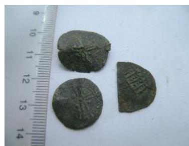
Фото 18. Наслідування (фальшовані денарії?) з рунічними (?) написами. Вага верхнього – 1,10 гр.; вага нижнього – 0,85 гр.; вага 1/2 денарія - 0,95. Місце знахідки Івано-Франківська область