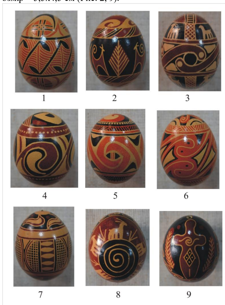
Рис. 2. Писанки за мотивами орнаментів трипільської культури. Автор Зоя Сташук

Писанка великодня (М-3460, КН-42838). Навкісним подвійним безконечником композиція орнаменту розбита на дві подібні частини. У цих частинах зображена антропоморфна фігура, у якої на животі – ромб, розділений на чотири частини, в центрі кожної з яких крапка, а на грудях спіраль-змій. З обох боків фігура обрамлена рослинами – «сосонкою». Праворуч і ліворуч від голови фігури – дві цятки – небесні світила. Тло писанки натурального бежевого кольору. Орнаментування – темно-коричневого і бежевого кольору. Розмір – 5,5x4,5 см (Рис. 2, 9).