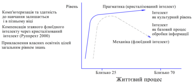
Рис. 1. Вплив когнітивної працездатності на передумови навчання старших дорослих [15]

Заслужують на увагу результати досліджень німецьких геронтологів У. Лер та Х. Тома [14] проведені в рамках Боннської геронтологічної студії (die Bonner Gerontologische Längsschnittstudie) та П. Балтеса з Макс-Планк Інституту в Берліні [2, с. 46-60]. Вони констатують, що вагомим для післядипломної подальшої освіти та придатним для навчання вважається “функціональний”, а не хронологічний чи календарний вік. Під “функціональним” віком розуміють вік як результат, процес, розвиток. Значно важливішою є не дата народження, стверджують вчені, а такі показники як фізичний та духовний стан здоров’я, спосіб життя, приналежність до певної соціальної верстви та культурно-освітній рівень. До важливих психологічних та соціальних факторів, які впливають на когнітивний потенціал старших дорослих належать: інтелектуальні якості, емоційна міцність, володіння стратегіями подолання кризових та стресових ситуацій, сексуальна активність, професійна задоволеність.