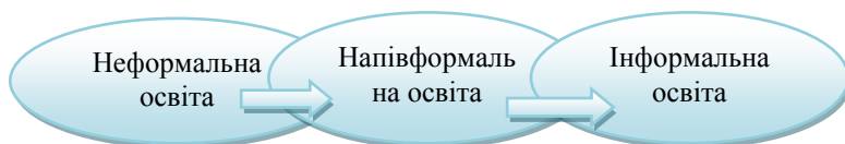
Рис. 2. Позиція напівформальної освіти (точка зору А. Кукульська-Хульма та Дж. Петіт)

напівформальну освіту в рамках різних товариств, спільнот. Наприклад, майстер-класи для та професійного розвитку, клуби однодумців, навчальна система бадді (навчання у форматі “товариш-товариш”), он-лайн середовища [15, с.33-36]. Таким чином, позиція напівформальної освіти чітко не визначається. Адаже особистісний розвиток переважно асоціюється з інформальною освітою, а он-лайн середовища можуть належати як до формальної освіти (у випадку дистанційного навчання з метою здобуття диплому), до неформальної освіти (у випадку он-лайн курсів) чи до інформальної освіти (спілкування у соціальних мережах). Графічно можна зобразити напівформальну освіту на межі неформальної та інформальної (рис. 2).