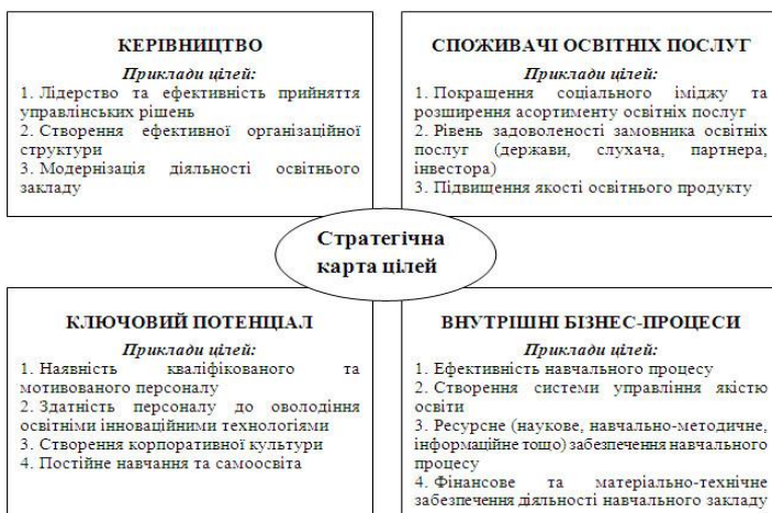
Рис. 1. Стратегічна карта цілей для умовного навчального закладу

починаючи від системи управління навчальним закладом, організації власне навчального процесу і, закінчуючи рівнем задоволеності слухача як головного споживача освітніх послуг (власне моніторинг якості освіти).