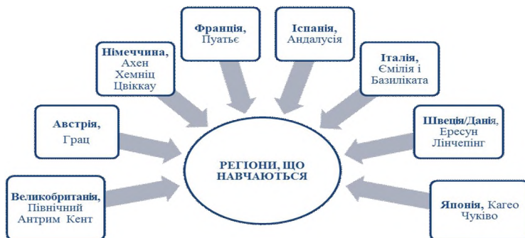
Рис. 1. Приклади регіонів, що навчаються

Саме поняття регіон, що навчається, стає невід'ємною складовою регіональних стратегій переважної більшості зарубіжних країн. Наприклад, Австрія, Велика Британія, Канада, Німеччина, США, Японія та ін. мають державні програми розвитку системи освіти дорослих через реалізацію проекту «Регіон, що навчається – суспільство, що навчається» (рис. 1).