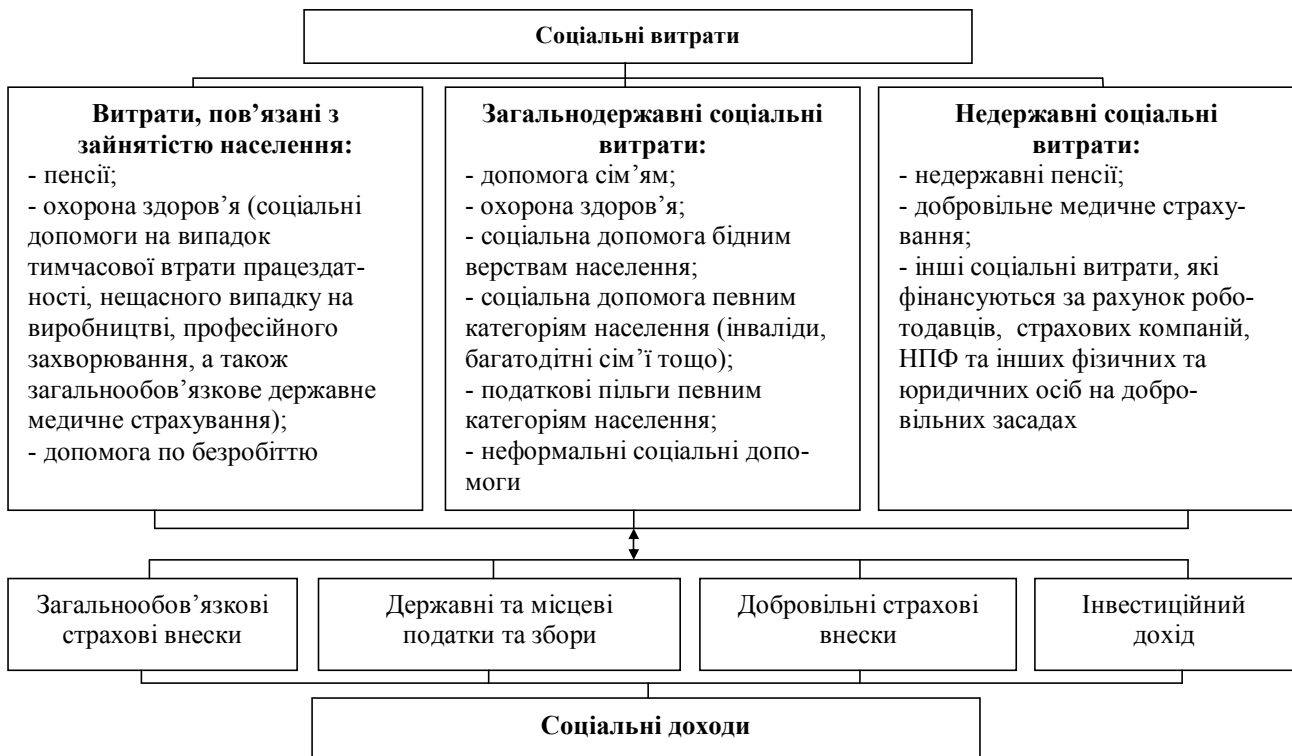
Рис. 1. Класифікація соціальних доходів та витрат

При розробці СССР слід враховувати, що структура соціального бюджету не схожа з класичним бюджетом, оскільки до неї пропонується включати як офіційні, так і неофіційні соціальні доходи та витрати. Водночас усі соціальні витрати та доходи можна подати у вигляді певних груп, які є притаманними усім національним системам соціального захисту (рис. 1).