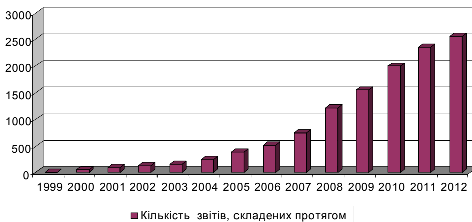
Рис. 2. Динаміка розвитку звітування за стандартами GRI [8]

стандартами GRI. Динаміка підготовки звітності зі сталого розвитку за стандартами GRI в світі наведена на рис. 2.