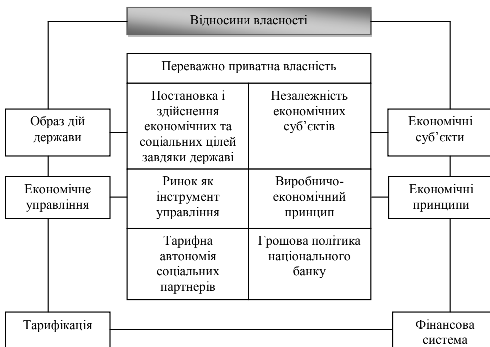
Рис. 1. Шлях, який повинне пройти людство згідно теорії соціального ринкового господарства

А. Мюллер-Армак вважав, що головною метою соціального ринкового господарства є координація взаємовідносин держави, суб'єктів ринку і соціальних груп у всіх сферах суспільного життя. При цьому ставиться акцент на тому, що соціальні та економічні цілі відіграють однаково важливу роль.