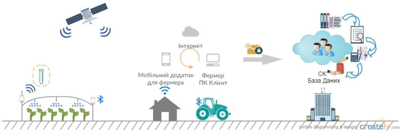
Рис. 2. ІоТ у ланцюзі організації страхового захисту аграрного підприємництва

іригаційною активністю та агрегувати дані по блокам для забезпечення точної звітності (рис. 2).