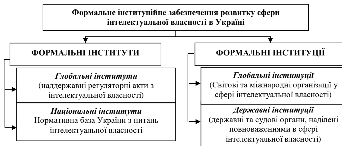
Рис. 2. Структура формальної складової інституційного забезпечення комерціалізації об'єктів інтелектуальної власності