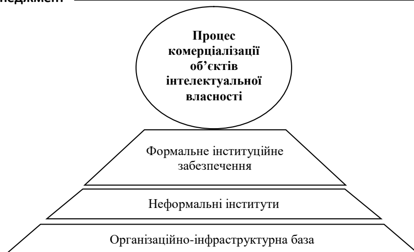
Рис. 1. Інституціональне забезпечення комерціалізації об'єктів інтелектуальної власності