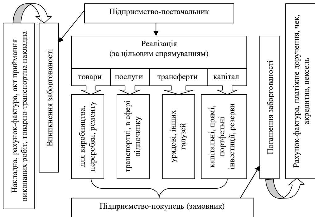
Рис. 3. Уніфікована схема обліку експортно-імпорتنних операцій

партнера, враховуючи його інтереси та цілі. Так, експорт/імпорт товару слід розглядати за об'єктами (товар, послуги, поточні трансферти, капітал), та за функціональним призначенням (товари для виробництва чи переробки; послуги транспортні чи інші; капітал (капітальні, прями, портфельні чи інші інвестиції)) (рис. 3).